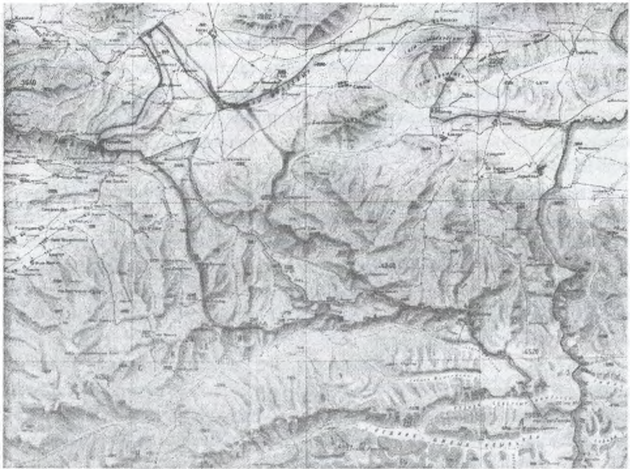
Карта, отражающая прохождение линии границы по вышеприведенному описанию (красная линия – линия по описанию, зеленая линия – граница бассейна реки Каркыра)

Разъяснение осложнения земельных вопросов, обстоятельства сужения территорий, представленных кыргызам после съезда 1873 года, представлено в информации, данной в подразделе “Отнятие у кыргызов земель к востоку от Санташа” раздела “Кара-киргизы под русским владычеством” книги Н. Аристова “Усуни и кыргызы или кара-киргызы” [2, с.578].